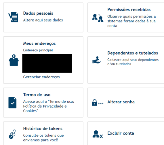
Imagem 04: Permissões recebidas