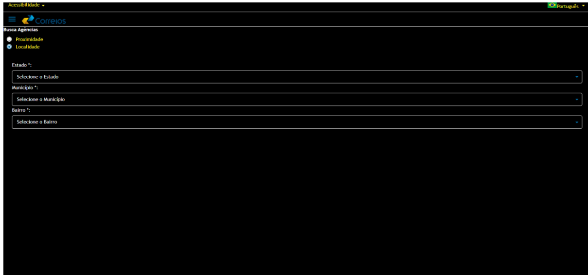
Tabela 03: Formulário para avaliação Heurística - Estética e Design visual Contraste